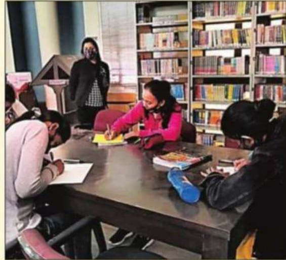
निबंध लेखन प्रतियोगिता में हिस्सा लेती छात्राएं।